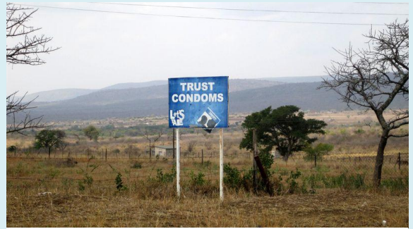
Bei der höchsten HIV/Aidsrate weltweit, ist die Regierung langsam erwacht...

von Tag zu Tag wie das Land grüner wird und es blühen jetzt schon viel mehr Bäume und Büsche als noch bei meiner Ankunft. An den Straßenrändern wachsen Papaya, Bananen, Ananas und vieles mehr. Die Menschen, vor allem hier in der Stadt, sind sehr freundlich, offen und sehr bemüht. Vor allem als Weiße wird man überall begrüßt, angelacht und in Gespräche verwickelt. Man trifft auf unheimlich hilfsbereite Menschen, aber aufpassen muss man natürlich immer und auch an die afrikanische Zeiteinstellung muss man sich gewöhnen. Alles dauert eben ein bisschen länger ☺