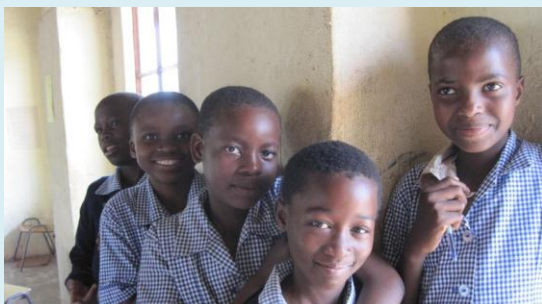
Kinder der Nyonyane Schule

jeglicher Art, über Gras- und Sisalkörbe bis Trommeln und Weihnachtsbaumschmuck ist wirklich alles dabei. Ihr könnt euch vorstellen, dass auch ich schon das ein oder andere passende für mich gefunden habe ☺ Swasiland ist generell ein wirklich wunderschönes Land. Momentan ist Frühling und das Wetter ist noch sehr wechselhaft. Letzte Woche hat es einen Tag genieselt und ich musste die dicken Socken und Fliesjacke