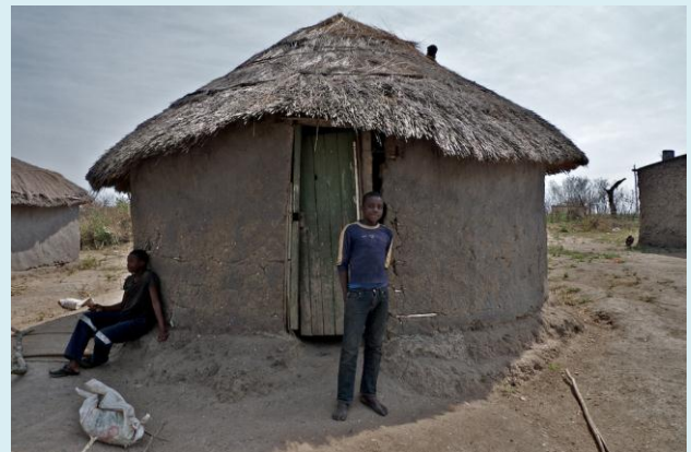
Eine Hütte des Kinderhaushaltes

Die Projekte von MEDEA e.V. befinden sich alle in den "rural areas", also im Busch. Und dort sieht es so aus, wie man sich den typisch afrikanischen Busch eben vorstellt. Keine befestigten Straßen, glühende Sonne, roter Staub, vereinzelte Hütten, immer wieder Feuer im Buschland am Straßenrand, an Elektrizität, fließend Wasser oder Handynetz ist nicht zu denken. Hier sind die Armut und der Hunger der Menschen spürbar und deutlich zu sehen. Unter anderem betreut MEDEA e.V. die Nyonyane Schule. Die Schule liegt fast 10km von der nächsten befestigten Straße entfernt und die 130 Kinder und 9 Lehrer müssen jeden Morgen und jeden Nachmittag viele Kilometer zur Schule laufen. Dort werden sie normalerweise mit zumindest einer warmen Mahlzeit am Tag versorgt, momentan ist dies aber aufgrund von Politik und anderer Probleme im Land nicht möglich. Ich werde